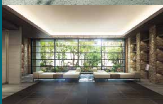
ホテルライクな内廊下設計