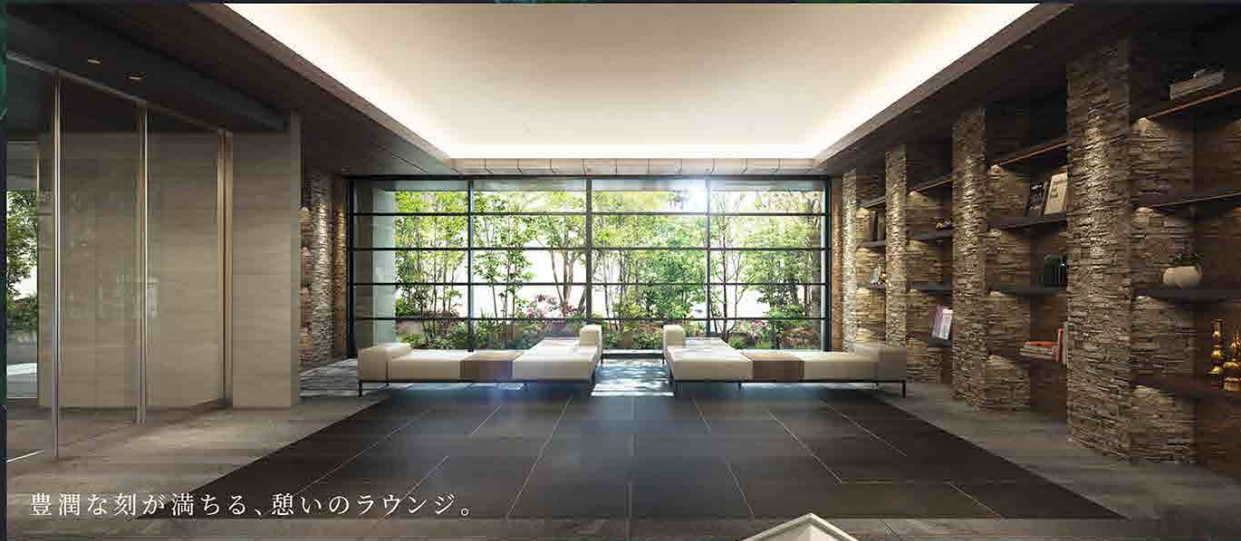
豊潤な刻が満ちる、憩いのラウンジ。